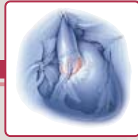
Valve O'Brien Stentless aortic valve Valve aortique stentless