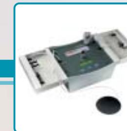
Incu Incubator Analyzer Testeur d'incubateur