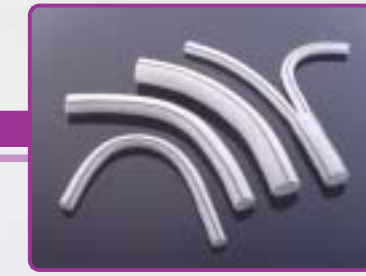
FlowNit Knitted polyester vascular graft Prothèse vasculaire en polyester tricoté