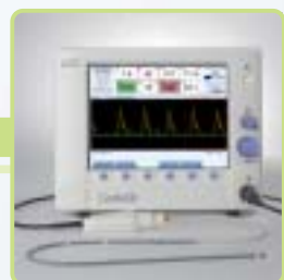
Cardio Q ODM