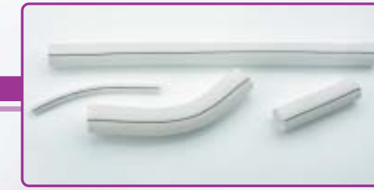
FlowWeave Woven polyester vascular graft Prothèse vasculaire en polyester tissé