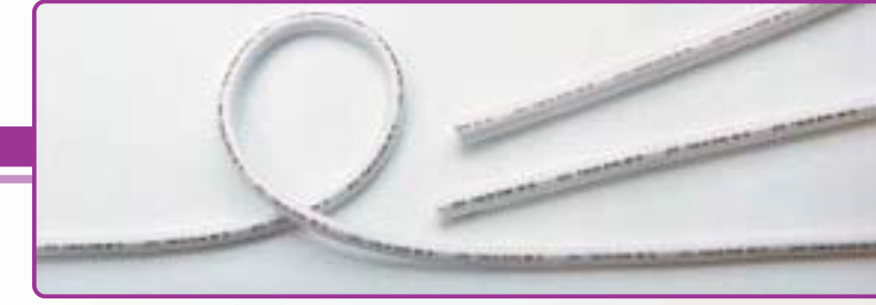
FlowLine Heparin / ePTFE vascular graft Prothèse vasculaire PTFE / héparinée