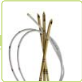
UP Nanoline, Sprotte, Plexolong, Stimulong, SonoPlex