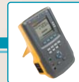
ESA612 Electrical Safety Analyzer Analyseur de sécurité électrique