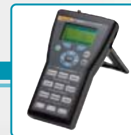
VT Mobile Ventilator Analyzer Testeur de ventilateur