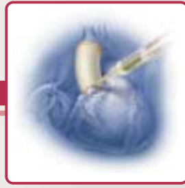
BioGlue Biological Glue Colle biologique