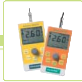
MulstiStim Sensor & Switch