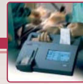
Irma TRUPoint Blood analysis System Analyseur de biologie