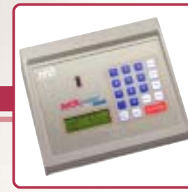
Avox 1000E Whole Blood Oximeter Analyseur d'oxymétrie