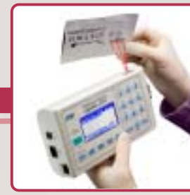
Signature Elite Microcoagulation system Coagulomètre