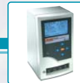
IDA4 Infusion Device Analyzer Testeur de perfusion