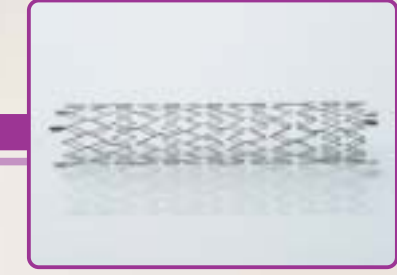
E-njoy Self expandable stent Stent auto-expandable